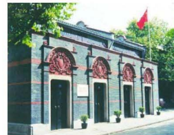
中国共产党第一次全国代表大会上海会址