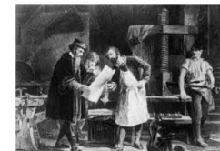
谷登堡改进印刷术