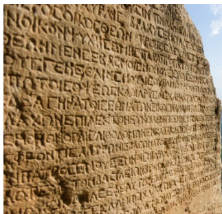
刻在大理石上的“儒略历”片段