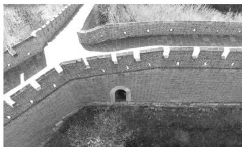
黄崖关长城的一处暗门