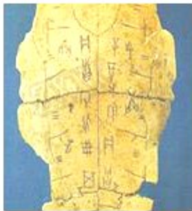
图一 我国最早的文字