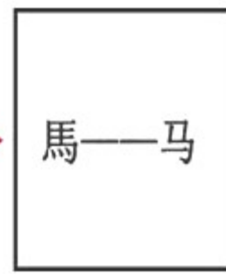
图三 汉字的繁体和简体

材料二 台湾与大陆血肉相连，同根同源，是不可分割的……1984年2月，邓小平明确指出，祖国统一后，“台湾仍搞它的资本主义，大陆搞社会主义，但是是一个统一的中国”。……1992年，海峡两岸达成“九二共识”，有力推进了两岸关系的发展。