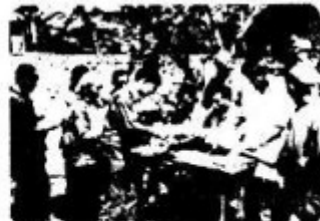
农民领取生产承包合同