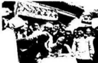
河北邯郸市郊农民报名入社