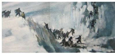
红军过雪山（艾中信作品）