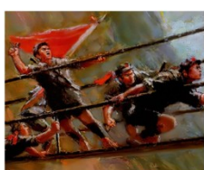
飞夺泸定桥（刘国枢作品）