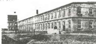
丙：创办于南通的大生纱厂

乙：为君之道，必须先存百姓。若损百姓以奉其身，犹割股以啖腹，腹饱而身毙。（摘自《贞观政要》）