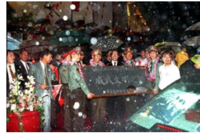
解放军驻港部队接管香港防