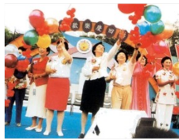
香港人民欢庆回归祖国