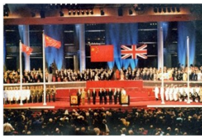
中英香港交接仪式