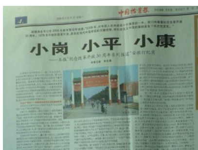
图一 《人民日报》1978年12月24日 图二 《中国档案报》2008年4月21日