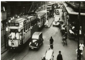
图1 民国时期的上海街景