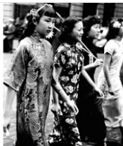
图2 上海南京路上的行人