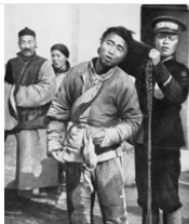
图3 辛亥革命后军警 为行人剪辫子