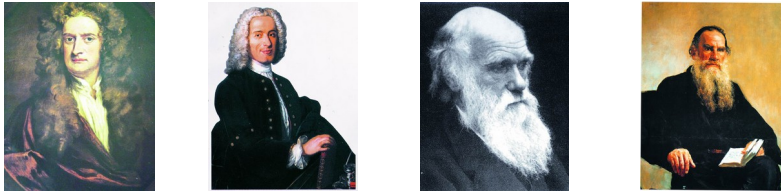
牛顿 伏尔泰 达尔文 托尔斯泰 A B C D

11.他是伟大的文学家，他的创作是世界现实主义文学的高峰之一，他被列宁称为“俄国革命的镜子”。他是