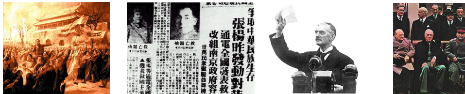
油画《五四运动》 报道西安事变的报纸 从慕尼黑返回的张伯伦 雅尔塔会议“三巨头” A B C D