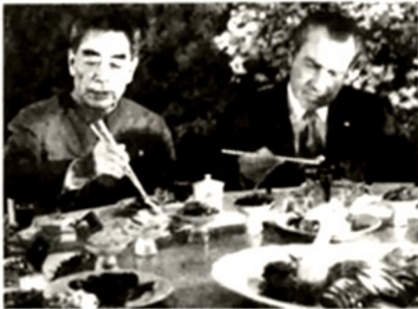
1972 年 2 月 27 日，招待尼克松总统的宴会