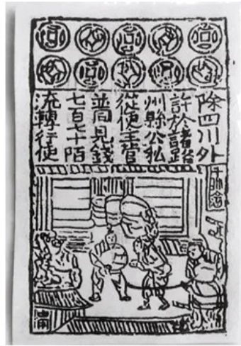
图2北宋纸币铜版拓片