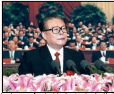
图3 邓小平在十一届三中全会上 图4 江泽民在中共十六大上作报告

(1) 根据材料一并结合所学知识，指出图1人物领导了什么革命？其革命的指导思想是什么？图2人物领导了什么起义？他在农村创造了什么革命局面？