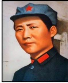
图1 孙中山 (1866-1925) 图2 到达陕北后的毛泽东