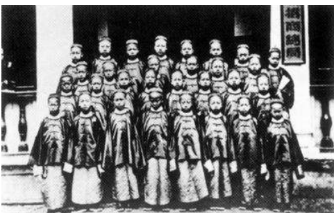
图9 中国派出的最早的留学生