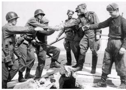
图7 “二战”时期的盟军宣传画 图8 1945年4月25日，美、苏士兵在德国易北河畔会师时拍摄的照片