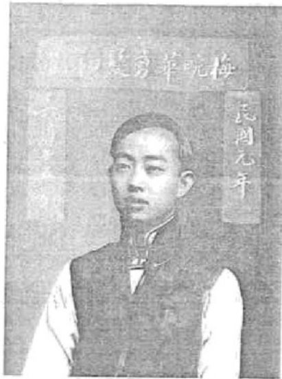
图2 1912年剪发后的梅兰芳