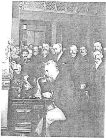
图1 1892年在纽约展示电话机的贝尔