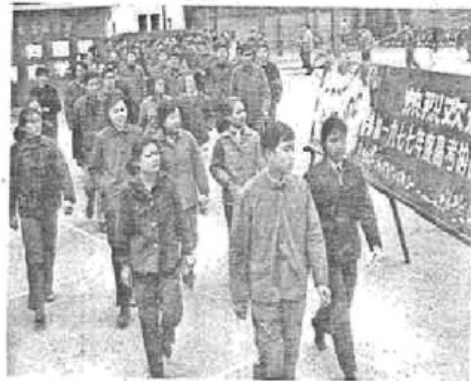
图4 1977年参加高考的考生

照片是触摸历史脉搏、感受生命温度的媒介。围绕“历史中的人”，提取以下一幅或多幅照片信息，自拟论题，展开论述。（要求：主题明确，史论结合，表述清晰）