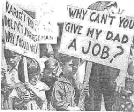
图3 1929年经济大危机中的孩子