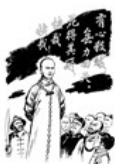
图 2 谭嗣同殉难图