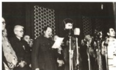
图 1 《开国大典》