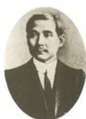
图 3 孙中山