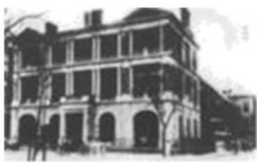
图 1 轮船招商局

5. 某校八年级小李同学以“中国近代化的探索”为主题，制作了下面的资料卡片。并对其所涉及的史实进行了解读，其中正确的是 ( )