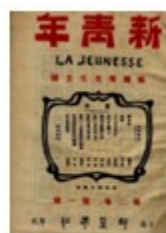
图 4 《新青年》封面