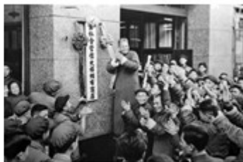
图 2 《上海市信大祥绸布店庆祝公私合营》

(3) 根据图 1 并结合所学知识回答.中国共产党领导中国人民经历了漫漫长路，终于完成了什么革命任务”？