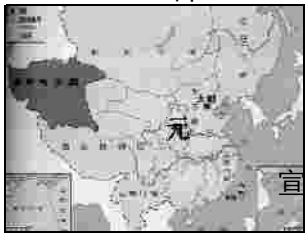
图 1 元朝疆域图

1727 年，清朝开始设立驻藏大臣，作为中央政府的代表长驻西藏，同达赖、班禅共同管理西藏。乾隆皇帝制定“金瓶掣签”制度，规定活佛转世的人选，