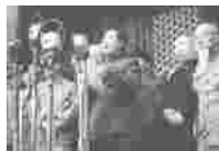
中共“一大”会址 开国大典