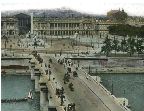
图三 19世纪中期的欧洲城市

材料三 设立雄安新区，是中央深入推进京津冀协同发展作出的一项重大决策部署，是千年大计、国家大事。坚持“高点定位”，坚持新发展理念。