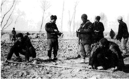
翻身农民丈量分配土地