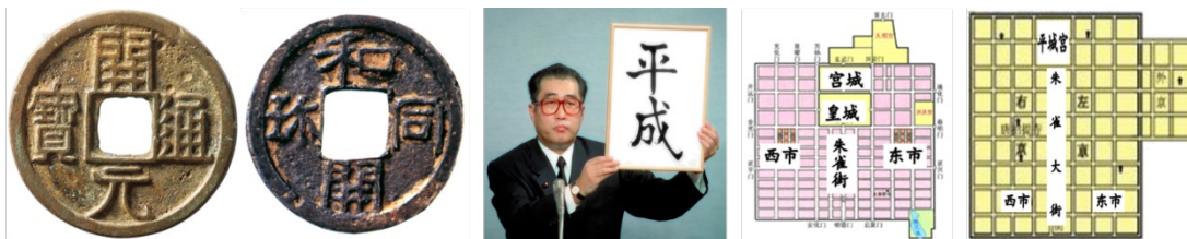
唐朝开元通宝 日本和同开珎 日本使用的文字 唐朝长安城 日本平城京

11. 中日山水相连，中国文化对日本有深远影响。从646年开始，日本仿效唐朝的典章制度，进行“大化改新”，积极吸收中国文化。最能反映下列五幅图片信息的诗句是（ ）