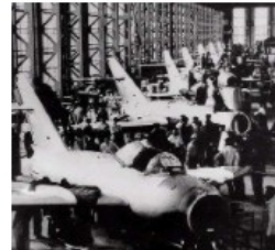
中国制造的第一批喷气式歼击机