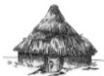
半地穴式圆形房屋复原图

1. 历史图片蕴涵了丰富的历史信息。下组图片反映的是哪一原始居民的生产、生活 ( )