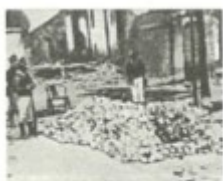
美军在北京抢劫的 白银（1900年）

发展资本主义的需要，更多地注重于掠夺原材料、商品销售市场以及资本输出场所等硬性政治资源；重视石油等重要战略物质资源的获得。