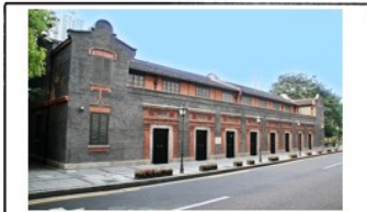
图A 中国共产党第二次全国代表大会会址 中共二大第一次明确提出党的最低纲领。纲领规定，在民主革命阶段，党的主要任务是打倒军阀，推翻帝国主义的压迫，将中国统一为真正的民主共和国。