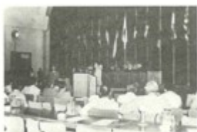
周恩来在万隆会议上发言