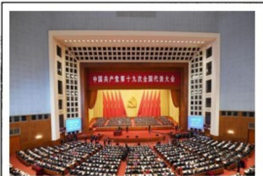
图C 中国共产党第十九次全国代表大会会场 在中共十九大上，习近平新时代中国特色社会主义思想被确立为中国共产党必须长期坚持的指导思想。

截至2021年6月5日，中国共产党党员总数为9514.8万名……党员受教育程度显著改善，大专及以上学历党员占比达52.0%；党员队伍职业分布更加广泛，企事业单位、社会组织管理人员和专业技术人员占比已达27.0%……2020年1月至2021年6月共发展党员473.9万名，其中35岁及以下的占80.7%……生产、工作一线发展党员数量持续增加，占发展党员总数的52.1%。