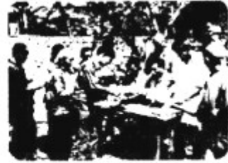
农民领取生产承包合同