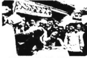
河北邯郸市郊农民报名入社