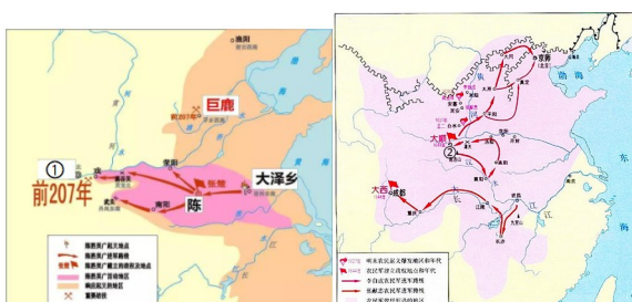
秦末农民起义形势图 明末农民起义形势图