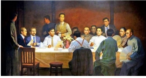
中国共产党第一次全国代表大会召开场景（油画）