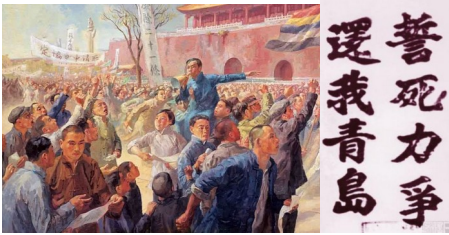
《五四运动》（绘画）誓死力争，还我青岛

美日在整个远东地区特别是中国，展开了争……在战后巴黎和会上以山东问题为焦点进行了激烈交……当时美国人民的一般心理是反战的，他们关心日本的对华侵略，更关心远东的和平……美国在谋求海上优势的同时希望通过国际合作的方式，确立以美国为主导的战后远东新秩序，因此提议召开华盛顿会议。