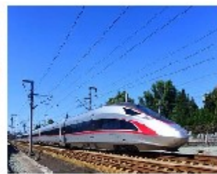
行驶中的“复兴号” 中国标准动车组