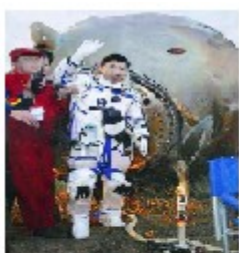
神舟五号载人飞船成功着陆 杨利伟走出舱门

7. 新中国的科学技术成就非凡。下列图片反映的科技成就属于 20 世纪 70 年代的是（ ）