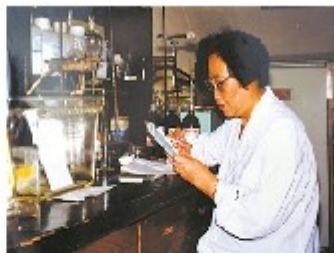
屠呦呦在实验室工作 (发现能够有效抵抗疟疾的青蒿素)