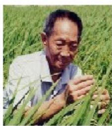
袁隆平在田间观察水稻 (成功培育出籼型杂交水稻)