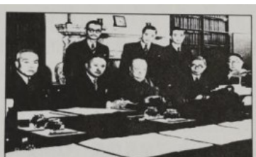
图二 通过《九国公约》

(1) 根据材料并结合所学知识，指出图一中事件在历史上被称为什么革命？这一事件的时间是哪一年？简述“威廉和玛丽加冕”对英国历史发展的重大影响。