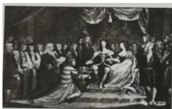
图一 威廉和玛丽加冕