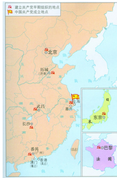
图 2 共产党早期组织创办的工人刊物 图 3 共产党早期组织分布示意图

材料二 今年是中华人民共和国成立 70 周年。70 年前，中国人民历经几代人上下求索，