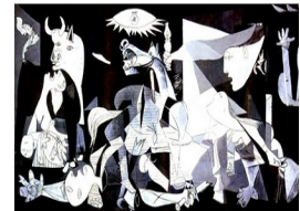
D. 图12 《格尔尼卡》