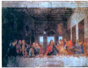
B. 图10 《最后的晚餐》