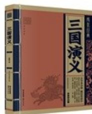
C. 图 3