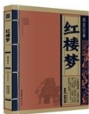
A. 图 1