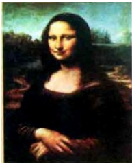
A. 图9 《蒙娜丽莎》