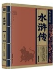
B. 图 2