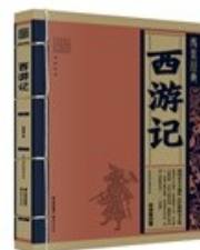
D. 图 4