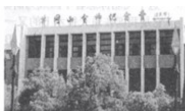
图2 井冈山会师纪念馆

9. 图2所纪念的历史事件对巩固扩大全国第一个农村革命根据地，推动全国革命事业的发展，具有深远的意义。当时，率领南昌起义队伍和湘南农民武装的是