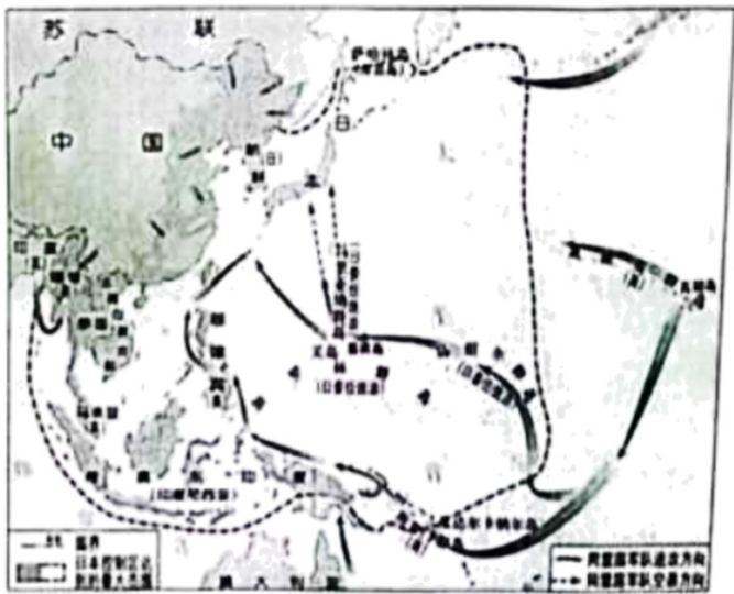
第二次世界大战期间的亚洲和太平洋战场示意图