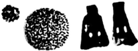
河姆渡遗址出土的稻谷和骨器