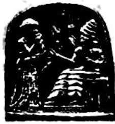
《汉谟拉比法典》石柱局部图