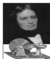
法拉第与电磁感应实验

(2) 以上材料中概括一个主题，根据上面图片(至少两幅结合所学知识予以说明)(5分)