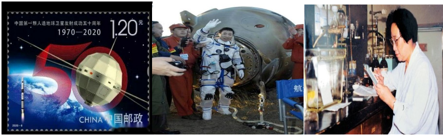
图1 图2 图3

(2) 图1 邮票纪念的“中国第一颗人造地球卫星”的名称是什么？图2 成就说明我国在航天技术上居于怎样的地位？图3 人物 2015 年在国际上获得了哪项大奖？