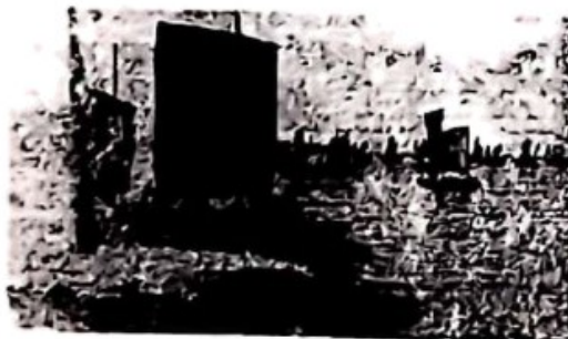
人民解放军强渡长江