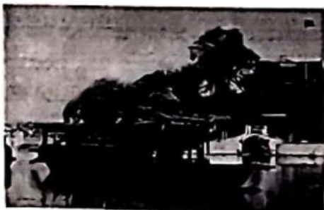
中共一大会址嘉兴南湖游船