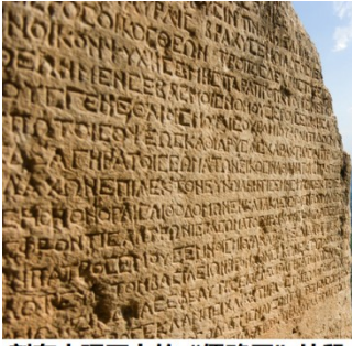
刻在大理石上的“儒略历”片段