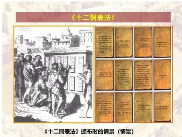
《十二铜表法》颁布时的情景（情景）