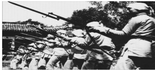
图 D 活跃于冀中平原的抗日武装——回民支队

(2) 材料二图 A 事件有何标志性？依据材料二，结合所学，概括抗日战争所体现的民族精神及抗战胜利的决定性原因。(3分)