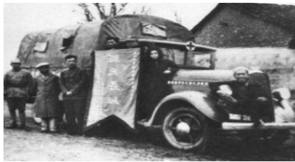
图 C 纽约侨胞支援抗战