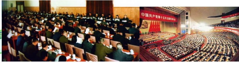
图 A 遵义会议会址 图 B 中共十一届三中全会 图 C 中国共产党第十五次全国代表大会会场