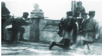
图 A 中国守军在卢沟桥奋起抗战