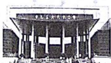
图三 台儿庄大战纪念馆

(4) 图一中的“甲午战争”爆发于哪一年？图二纪念的“五四运动”是一次什么性质的运动？图三纪念的“台儿庄大战”的主要指挥者是谁？