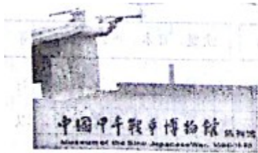
图一 中国甲午战争博物馆