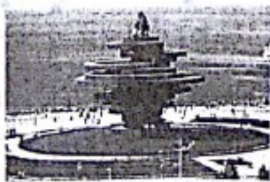
图二 青岛五四广场