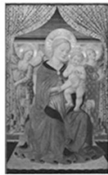
圣母、圣婴和天使，15世纪中期 图1

15.观察下面两幅图片，图1为15世纪中期《圣母、圣婴和天使》，图2为1500年《朝拜圣婴》。从中可以看出