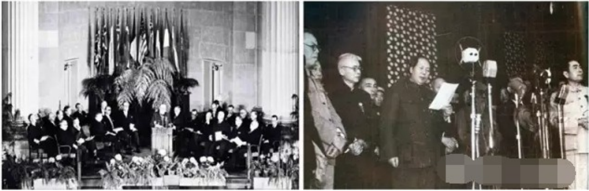
图一（左）北大西洋公约组织成立