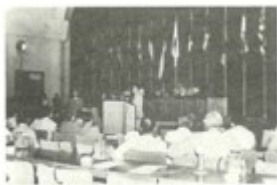
周恩来在万隆会议上发言