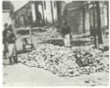
美军在北京抢劫的 白银（1900年）

材料一 19世纪末，美国逐步把目光转向海外，亚洲远东地区成为美国率先觊觎的目标……美国出于发展资本主义的需要，更多地注重于掠夺原材料、商品销售市场以及资本输出场所等硬性政治资源；重视石油等重要战略物质资源的获得。