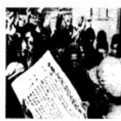
《中华人民共和国土地改革法》