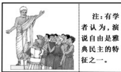
图6 雅典人在发表演说