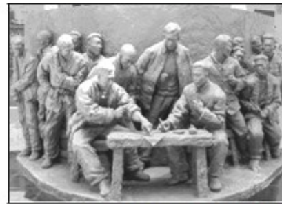
图4 (小岗村农民共按手印群雕)