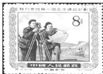
图2 (一五计划纪念邮票)