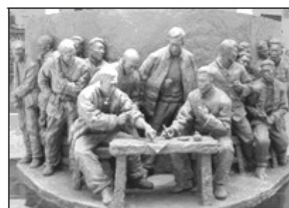
图4 (小岗村农民共按手印群雕)