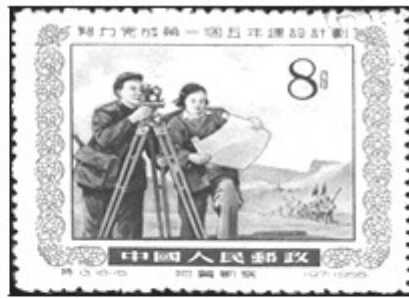
图2 (一五计划纪念邮票)