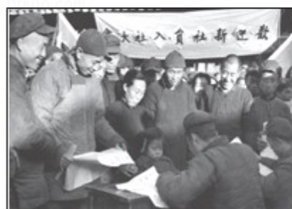
图3 (新社员入社大会照片)