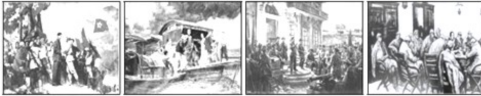
①井冈山会师创新路 ②南湖游船开天地 ③八一枪声建军队 ④遵义会议扭乾坤

19. 下列是某校为举办“中国共产党早期奋斗历程”图片展而搜集的图片，请你按事件发生的先后排序（ ）