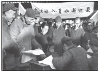
图3 (新社员入社大会照片)