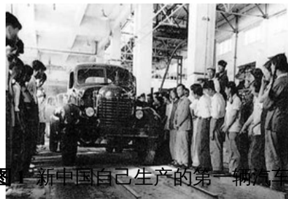
图 1 新中国自己生产的第一辆汽车