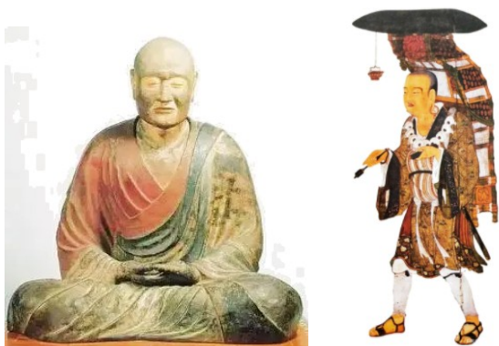
图一 奈良唐招提寺内的鉴真像 图二 玄奘西行求法图

材料三：从 1405 年到 1433 年的 28 年间，那和率船队 7 次下“西洋”，船队最多时有船 200 多艘，27000 多名官兵……航程总计 16 万海里，历经东南亚（又称南洋）、南亚、西亚和东非的 30 多个国家和地区。