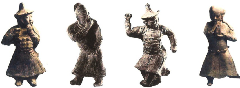
吹笛 吹口哨 舞蹈 击节板