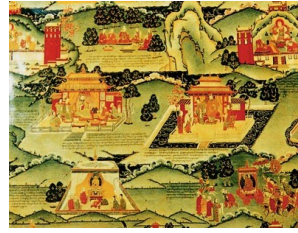
图2 文成公主入吐蕃壁画