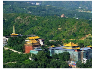
图4 清须弥福寿之庙