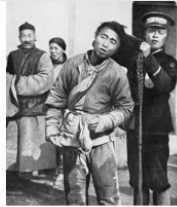
图3 辛亥革命后军警为行人剪辫子