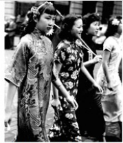
图2 上海南京路上的行人