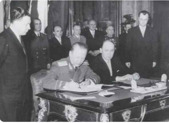
《北大西洋公约》签字仪式