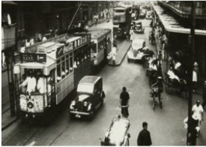
图1 民国时期的上海街景