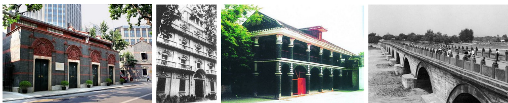
中国共产党第一次 南昌起义 遵义会议会址 卢沟桥 全国代表大会会址 指挥部

2、（2009·河南）建筑是浓缩的历史，下列建筑中见证了中国全面抗战开始的是（ ）