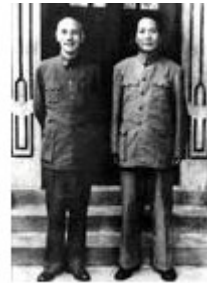
蒋介石与毛泽东合影