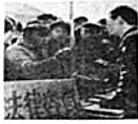
律师向群众宣传法律知识

(3) 据材料三并结合所学知识指出，我国加强民主法制建设的主要措施及重大成效，20世纪末，我国提出了怎样的“法治”目标？