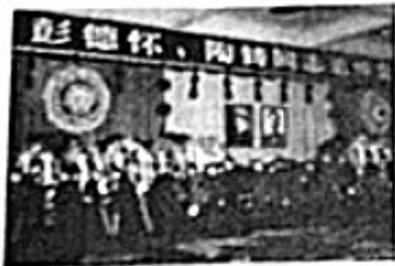
为文革中被迫害致死的同志平反