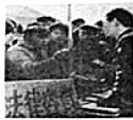
律师向群众宣传法律知识

（3）据材料三并结合所学知识指出，我国加强民主法制建设的主要措施及重大成效，20世纪末，我国提出了怎样的“法治”目标？