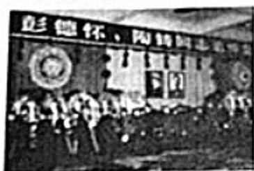
为文革中被迫害致死的同志平反