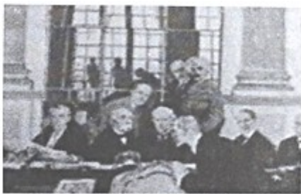
图1 签署《凡尔赛条约》