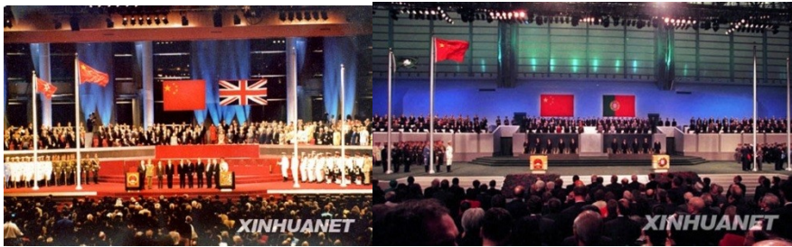
图 9 中英香港政权交接仪式图 10 中葡澳门政权交接仪式

15 . 祖国统一是历史发展的必然趋势。下面两幅图片反映的历史事件是中国政府解决历史遗留问题的成功范例。它践行了（ D ）