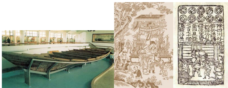
图 12 南宋海船图 13 宋代《货郎图》 14 北宋纸币铜版拓片