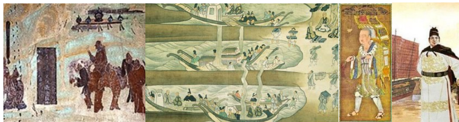
图 1 张骞通西域图 2 鉴真东渡图 3 玄奘西行图 4 郑和下西洋

4．图片是历史学习的重要资料。小勇在自主学习中搜集到以下一组图片，他要为这组图片拟定一个主题。最恰当的应是（ D ）