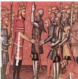
缔结封君封臣关系的仪式

17. 某班历史复习课展示了三张图片。图一封君和封臣。图二庄园地图。图三大学分布图。这节复习课的主题应该是（ ）