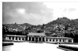
延安革命纪念馆（陕北）