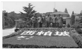
西柏坡纪念馆（河北）

(1) 如果有机会去参观上述六个纪念馆中的两个，你会选择哪两个？写出你所选的两个纪念馆，分别写出一条选择的理由。（要求：选答两个，多选多答则只评前两个）