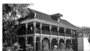
遵义会议纪念馆（贵州）