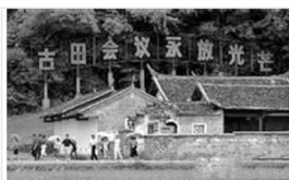
古田会议纪念馆（福建）