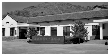
南泥湾大生产运动展览馆（延安）