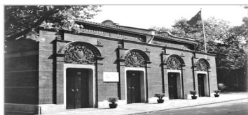
中共一大会址纪念馆（上海）

材料 以下六个纪念馆映证了中国共产党领导新民主主义革命历程中的重大史实，是对青少年进行爱国主义教育和党史教育的重要基地。